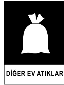
DiĞER EV ATIKLARI