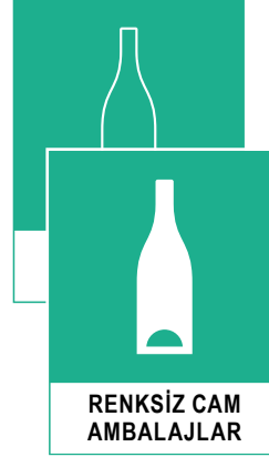
RENKSİZ CAM AMBALAJLAR